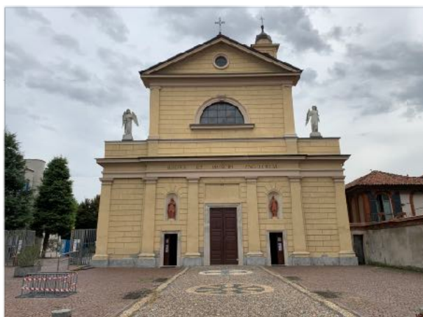
Il nostro sagrato che i ragazzi stanno rinnovando

Penso all'impegno della comunità adulta di trasmettere la fede alle generazioni più giovani, sia all'interno della famiglia che è la prima scuola di fede, sia all'interno